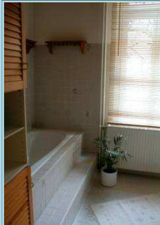
...und ein Einblick ins Bad 7,62 m2