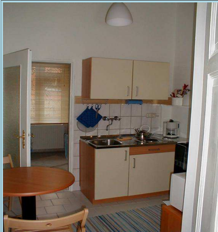
5,85 m2 groß mit Anschluß ans Bad...