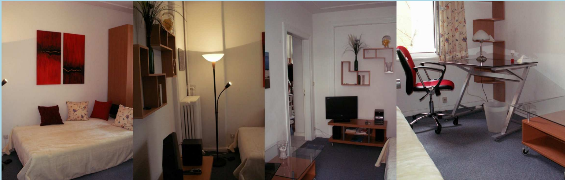
Das 12,3 m2 Wohn-/SchlafGEMACH

Dieses kleine aparte Appartement ist zu mieten. 1)